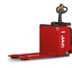
Перевозчик паллет CBD20