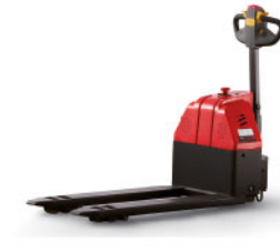
Перевозчик паллет CBD15