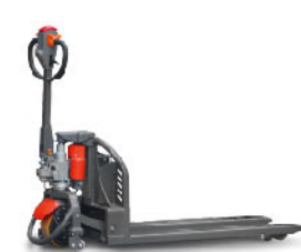
Электророхля CBD12 Li-ion