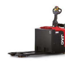
Перевозчик паллет CBD30