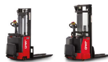
CDD10 CDD12 | CDD16, CDD20 серии Standart