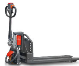
Электророхля CBD15 Li-ion