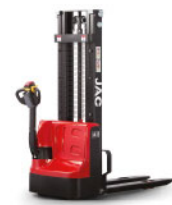
CDD10 CDD12 CDD15 серии Compact