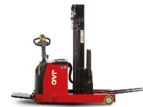
CDDC16 Штабелер с выдвигной мачтой